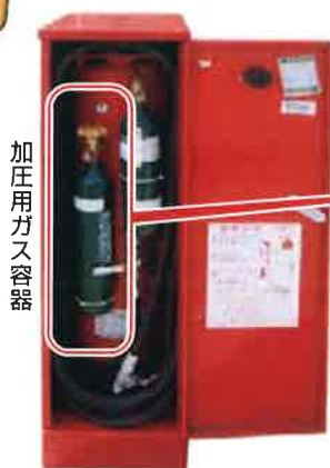
移動式粉末消火設備